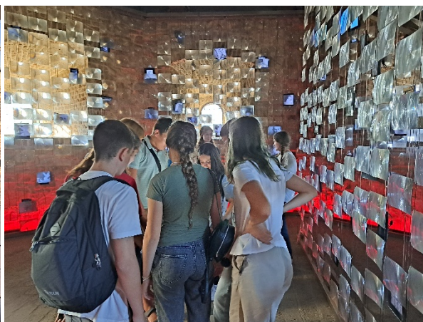
Изложбена поставка- Кула Небојша као тамница

Први српски устанак-Изложба на другом нивоу Куле Небојше посвећена је Првом српском устанку и настанку модерне српске државе почетком 19. века.