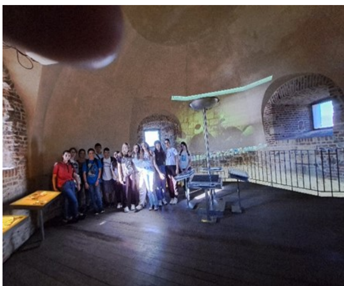
Изложбена поставка у кули Небојша