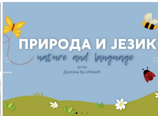
Изложба „Природа и језик“

Кратка предавања у Планетаријуму: курс астрономије за почетнике-Привидно кретање планета.