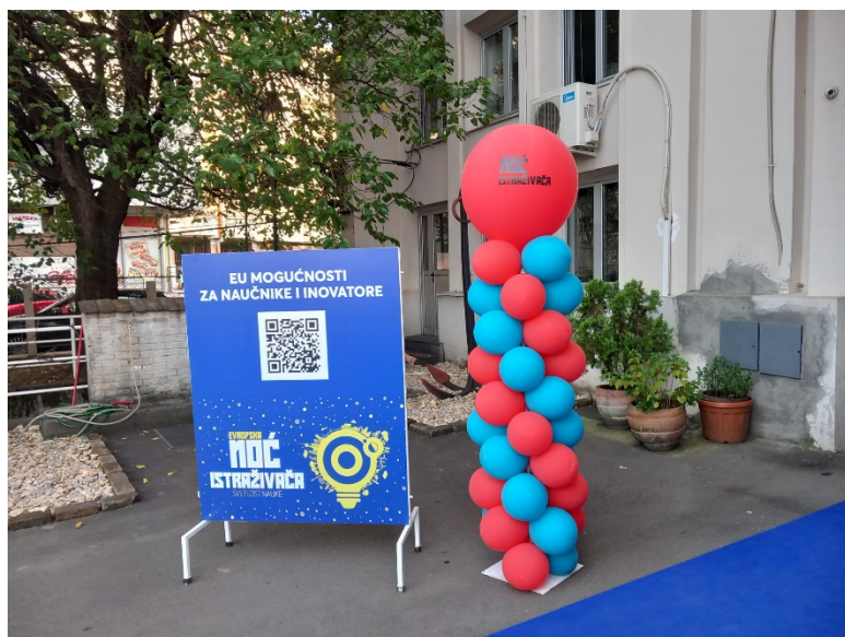
Музеј Науке и Технике

Ученици и наставници у музеју су били у прилици да на правом научном базару са поставкама Центра за промоцију науке, Фонда за иновациону делатност и Фонда за науку, базираним на резултатима улагања Европске уније у Србији, учествују у експериментима, квизовима, дискусији са организаторима манифестације (професори, студенти, научни сарадници), успоставе нове контакте, и проведу време у успостављању сарадњи са институтима, буду награђени, интервијушу учеснике и волонтере Ноћи истраживача, и друго.